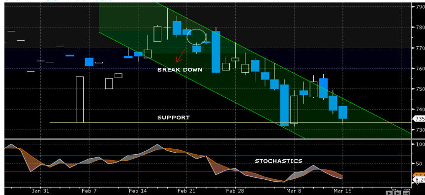
Grafik MSCI Indonesia