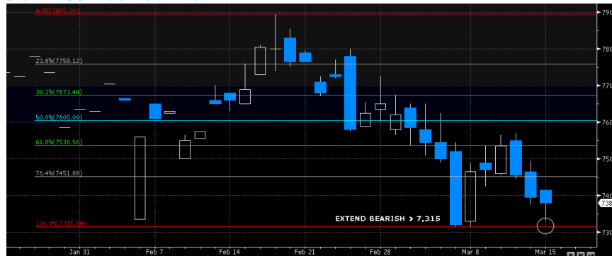
Grafik MSCI Indonesia Index 2

Dari pasar luar negeri, kekhawatiran pasar akan perang dagang yang terjadi antara Amerika Serikat dan China terkait dengan tariff impor baja dan aluminium. Hal ini terbukti memberikan beban terhadap pasar global dimana indeks saham Amerika Serikat dan Asia maupun Eropa berguguran. Selain itu, rilis data dari Departemen Perdagangan AS yang melaporkan penjualan ritel yang turun sebesar 0,3% pada bulan Febuari 2018 menambah tekanan terhadap pasar global. Secara fundamental baik domestik maupun luar negeri memberikan sentimen negatif terhadap MSCI Indonesia Index yang memberikan indikasi lanjutan pelemahan.