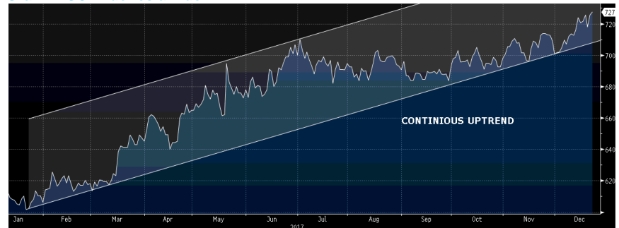
Grafik MSCI Indonesia Index 2

Dari luar negeri, euforia perpajakan Trump yang disetujui oleh DPR AS dimana tingkat pajak perusahaan turun dari 35% menjadi 21% membuat sejumlah kepercayaan pelaku pasar kembali meningkat. Sentimen perpajakan ini juga mengantarkan sejumlah bursa Asia bergerak menghijau. Dari Eropa, menjelang libur natal Indeks Stoxx Europe setelah ada perdamaian politik Catalonia kembali menemukan jalan keluarnya. Sentimen luar negeri turut memberikan sumbangsih kepada hijauanya MSCI Indonesia Index. Secara outlook global, MSCI Indonesia Index masih berada di teritori positif.