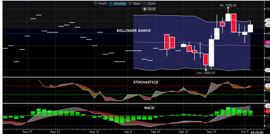
Grafik MSCI Indonesia 1